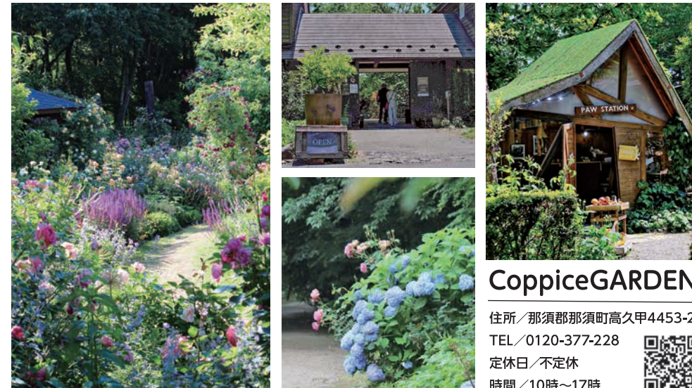
初夏のバラが見頃を迎えた園内。これからの梅雨の季節には紫陽花も咲き始め、散策をより楽しませてくれます。

季節の草木が咲き誇るコピスガーデン。日本語で「雑木林」を意味する名の通り、豊かな森に囲まれた園内は、日常を忘れて心地よい時間を過ごせる癒やしの空間です。